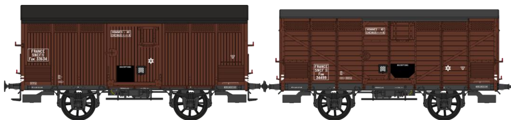
Réf. WB-296 - Set de 2 Wagons PRIMEUR PLM Type I / Type II - Ep.III A W-026-H-04 Primeur, freiné, châssis PLM, roues à rayons, frises bois verticales N°Faw 33634 W-026-I-06 Primeur, freiné, châssis PLM, roues à rayons, frises bois horizontales, porte avec volet N°Faw 34499