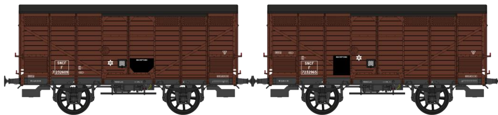
Réf. WB-297 - Set de 2 Wagons PRIMEUR PLM Type III - Ep.III B W-026-J-05 Primeur, freiné, châssis PLM, roues à rayons, frises bois horizontales, porte avec volet N°F 7232609 W-026-J-06 Primeur, freiné, châssis PLM, roues à rayons, frises bois horizontales, porte avec volet N°F 7232965