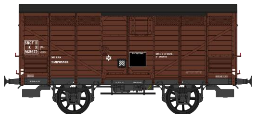
Réf. WB-298 - Wagon PRIMEUR PLM Type II Ep.III B W-026-I-07 Primeur, freiné, châssis PLM, roues à rayons, frises bois horizontales, porte avec volet N°F 995972