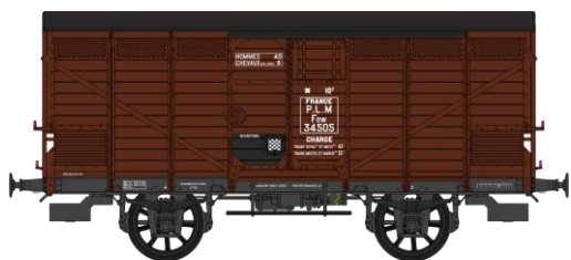
Réf. WB-295 - Wagon PRIMEUR PLM Type II / Ep.II – PLM W-026-I-05 Primeur, freiné, châssis PLM, roues à rayons, frises bois horizontales, porte avec volet N°Faw 34505