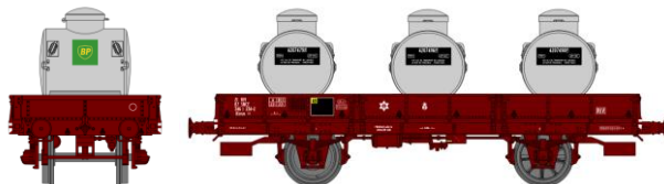
Réf. WB-131 – Wagon PLAT OCEM 29 Ep.IV W-008- E-05 Wagon freiné, boîtes d'essieux à coussinets, 1 roue à rayons, 1 roue pleine n°21 87 346 1 234-2 3 Containers Citernes BP