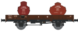
Réf. WB-058 - Wagon PLAT OCEM 29 Ep.III W-008-B-01 Wagon frein à main, boîtes d'essieux à coussinets, roues à rayons N°Jho 104503