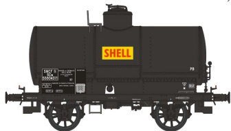
Réf. WB-194 - Wagon Citerne OCEM 19 Ep. III W-021-P-01 - Citerne rivetée, boîtes d'essieux U1, freiné, avec réchauffeur, 'SHELL' N°559343