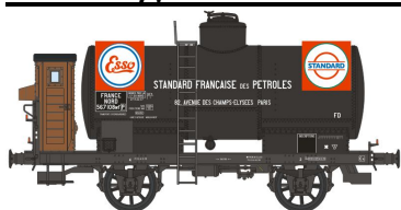
Réf. WB-188 - Wagon Citerne OCEM 19 Ep. II NORD W-021-K-01 - Citerne rivetée, boîtes d'essieux U1, 'ESSO STANDARD' N°56108