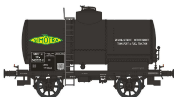
Réf. WB-193 - Wagon Citerne OCEM 19 Ep. III W-021-N-01 - Citerne rivetée, boîtes d'essieux U1, freiné, avec réchauffeur 'SIMOTRA traction' N°562025