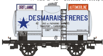
Réf. WB-190 - Wagon Citerne OCEM 19 Ep. II ETAT W-021-M-02 - Citerne rivetée, boîtes d'essieux U1 'DESMARAI FRERES' N°521605