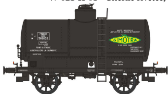
Réf. WB-189 - Wagon Citerne OCEM 19 Ep. II NORD W-021-D-01 - Citerne rivetée, boîtes d'essieux U1, avec réchauffeur 'SIMOTRA' N°568115