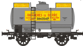
Réf. WB-192 - Wagon Citerne OCEM 19 Ep. II PLM W-021-M-01 - Citerne rivetée, boîtes d'essieux U1 'RAFFINERIES DE BERRE' N°584354