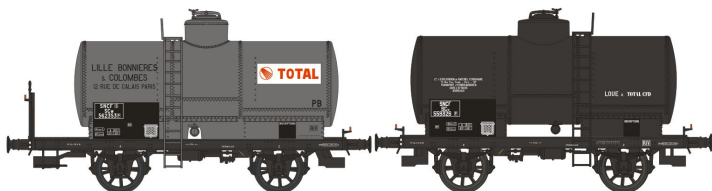
Réf. WB-195 - SET de 2 Wagons Citernes OCEM 19 Ep. III W-021-O-01 - Citerne rivetée, boîtes d'essieux U1, plateforme serre-freins, 'TOTAL' N°562353 W-021-J-01 - Citerne rivetée, boîtes d'essieux à coussinets, freiné, 'loué TOTAL' N°559326