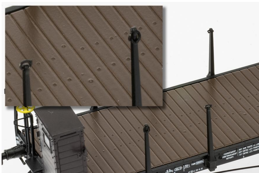
Détails des ranchers