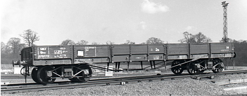
Plat à bords décalés

REE reproduit pour la première fois en grande série les wagons PLATS USA 1918. Les plats à bord de cette série N°3 sont différents de ceux déjà produits précédemment. Les ridelles rabattables sont décalées, avec deux grandes ridelles à gauche et trois petites ridelles à droite.