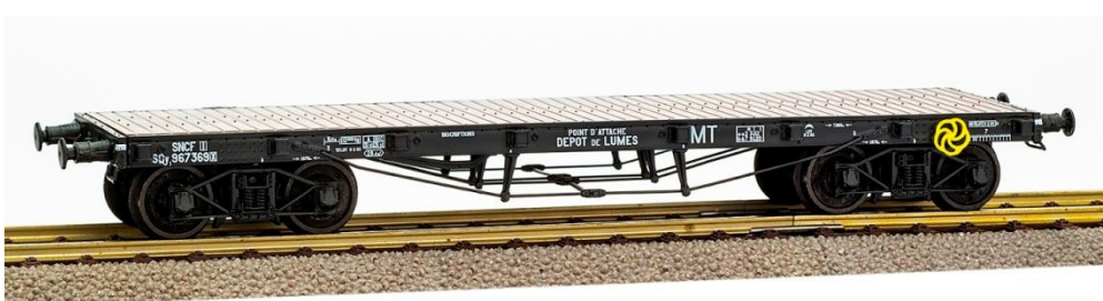
Plat sans rancher