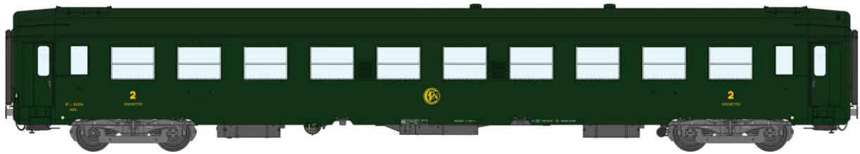
Réf. VB-178 - VOITURES UIC Couchette Ep III logo rond

V009-A-11 N° 52354 B9C9 Vert Celtique 301, châssis gris