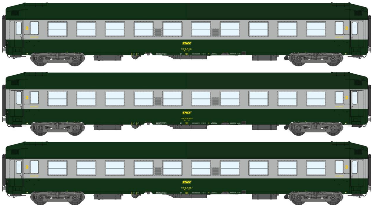
Réf. VB-179 - COFFRET 3 VOITURES UIC Couchette Ep IV- Vert - Aluminium

V009-A-11 N° 52354 B9C9 Vert Celtique 301, châssis gris