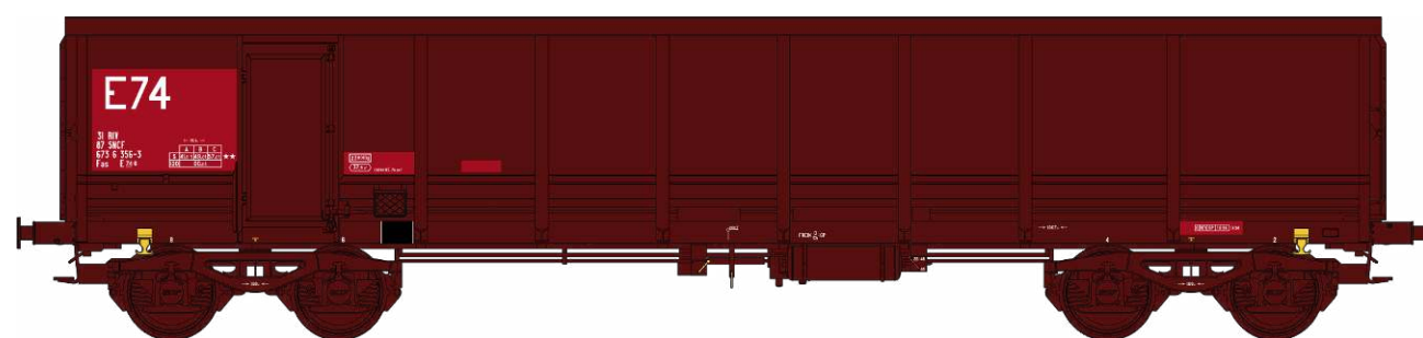
Réf. WBSE-015 - Wagon TOMBEREAU FAS Ep.V Bogie Y25 (REE) N°31 87 673 6 356-3 sans passerelle bicolore brun E84 + panneaux R606 (1994)