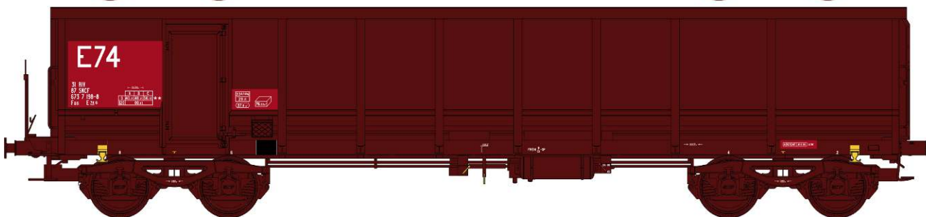
Réf. WBSE-014 - Set de 2 Wagons TOMBEREAU FAS Ep.V Bogie Y25 (REE) N°31 87 673 7 606-0 sans passerelle (1994) & N°31 87 673 7 198-8 avec passerelle (1996)