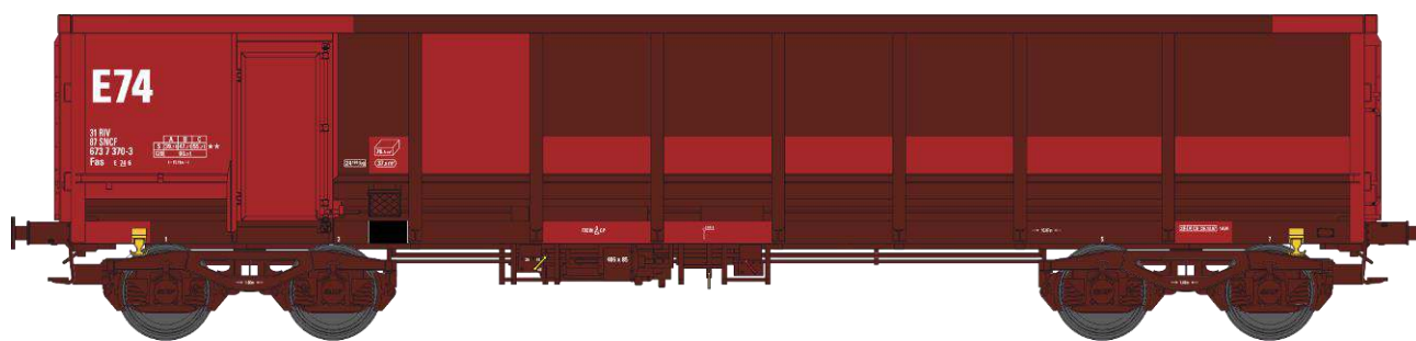
Réf. WBSE-017 - Wagos TOMBEREAU FAS Reconstitués Ep.V Bogie Y25 (REE) N°31 87 7 370-3 sans passerelle bicolore brun E84 + panneaux R606 (2004)