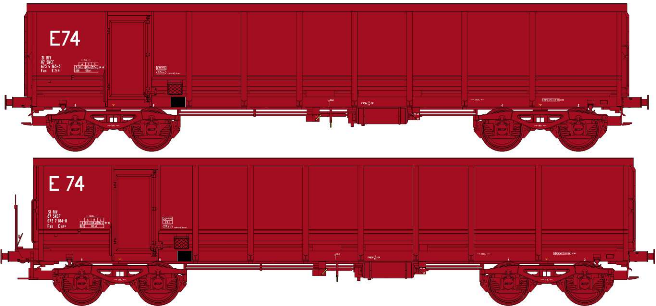
Réf. WBSE-012 – Set de 2 Wagons TOMBEREAU FAS Ep.V Bogie Y25 (REE) N°31 87 673 6 163-3 sans passerelle & N°31 87 673 7 184-8 avec passerelle (1994)