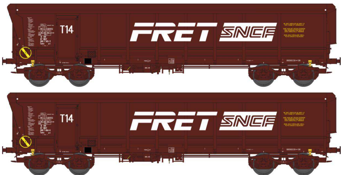
Réf. WBSE-007 - Set de 2 Wagons TOMBEREAU Tams Ep.V Bogie Y25 (REE) FRET SNCF N°31 87 080 7 345-3 & N°31 87 080 7 406-6 brun E84 (2000)