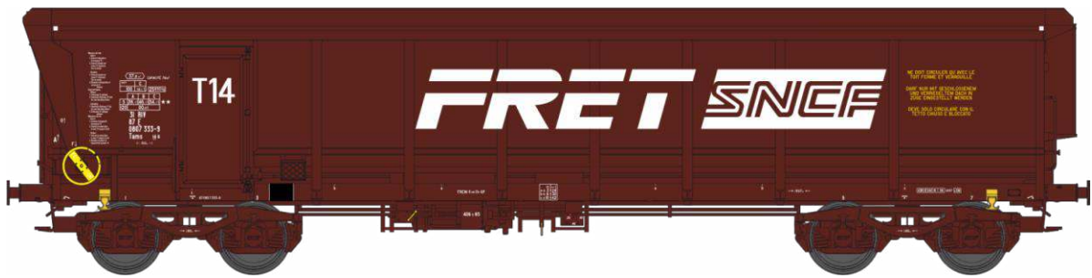
Réf. WBSE-009 - Wagon TOMBREAU Tams Ep.V Bogie Y25 (REE) FRET SNCF N°31 87 080 7 333-9 brun E84 (2000)