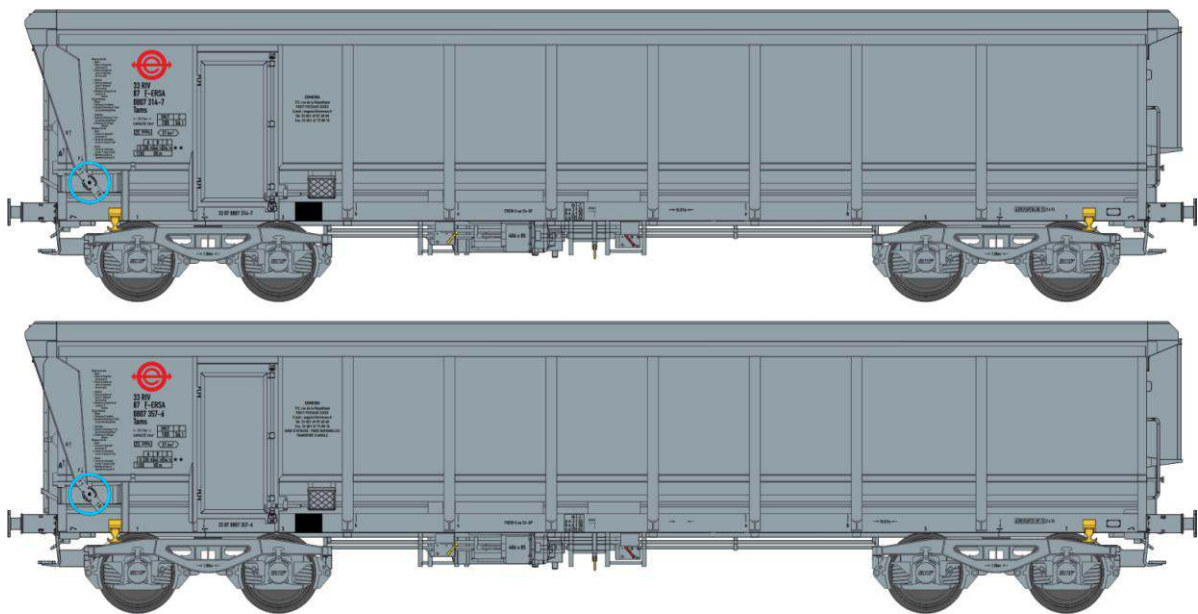
Réf. WBSE-010 - Set de 2 Wagons TOMBREAU Tams Ep.V Bogie Y25 (REE) ERMEWA N°33 87 0807 314-7 & N°33 87 0807 357-6 gris (2015)