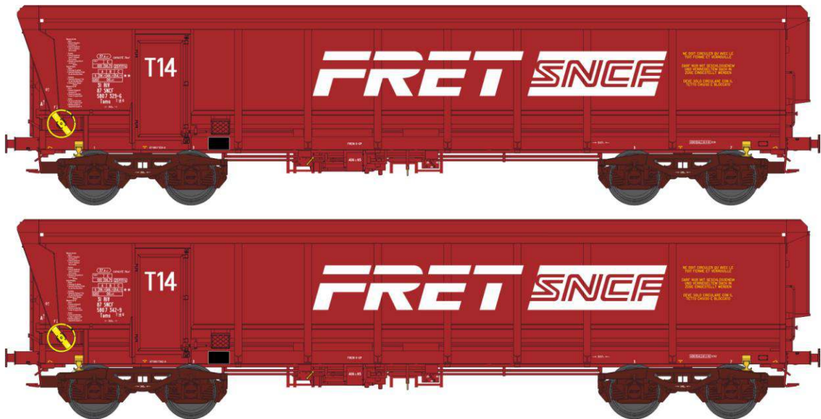
Réf. WBSE-006 – Set de 2 Wagons TOMBEREAU Tams Ep.V Bogie Y25 (REE) FRET SNCF N°31 87 580 7 329-6 & N°31 87 580 7 342-9 rouge 606 (1992)

Cette série est consacrée aux wagons type Tams avec couvercle télescopique. Les bogies sont des Y 25 REE et les wagons sont fabriqués par Sud Express. Les marquages sont conçus et les couleurs validées par REE