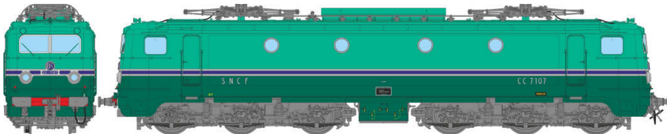
CC 7107 dépôt de PARIS-SO, jupes échanrées, fanaux obturés Ep.III-IV CC 7107, PARIS-SO, cut skirts, closed top lights Era.III-IV