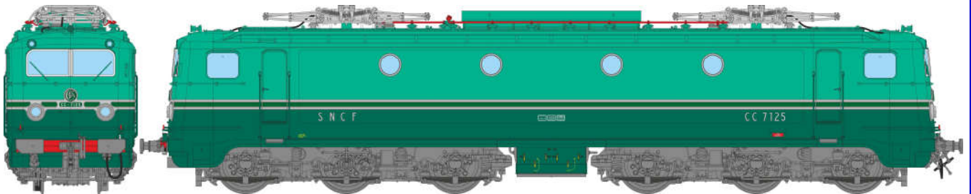
CC-7125 dépôt de LYON-MOUCHE, version d'origine, pantographes gris clair Ep.III CC-7125, LYON-MOUCHE, origin version, light grey pantographs Era.III

Réf. MB-195SAC – AC Sound Pantos Fonctionnels / AC Sound Functional Panto