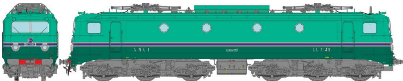
CC 7149 dépôt d'AVIGNON, déjupée, fanaux obturés, marquages Blancs Ep.IV CC 7149, AVIGNON, removed skirts, closed top lights, white markings Era.IV

Réf. MB-193SAC - AC Sound Pantos Fonctionnels / AC Sound Functional Panto