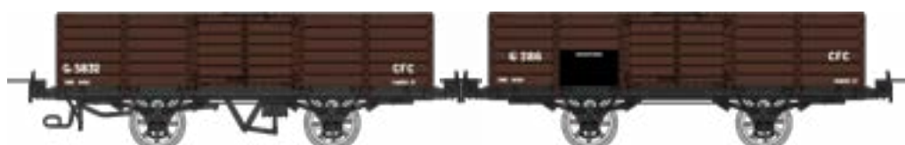
WM-033 Coffret de 2 tombereaux freiné et non freiné, bruns, CFC, Gv 5832 et G 286