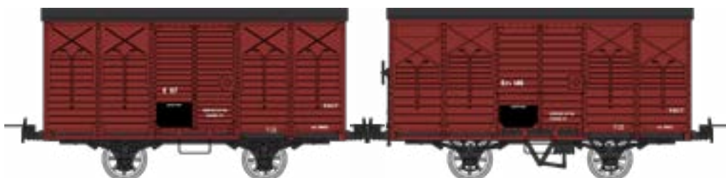
WM-030 Coffret de 2 couverts non freiné et freiné, toit rond et toit 2 pentes, Rouge UIC SNCF - K 97 et Kifv 146