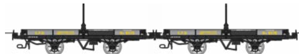
WM-035 Coffret de 2 plats porte-grumes freinés, gris et ferrures noires, CFD Htv 6575 et Htv 6576