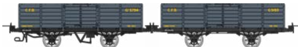
WM-032 Coffret de 2 tombereaux freiné et non freiné, gris foncé, Gv 5794 et G 5193