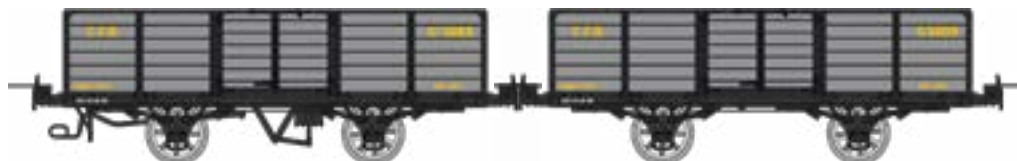
WM-031 Coffret de 2 tombereaux freiné et non freiné, gris et ferrures noires, Gv 5683 et G 5209