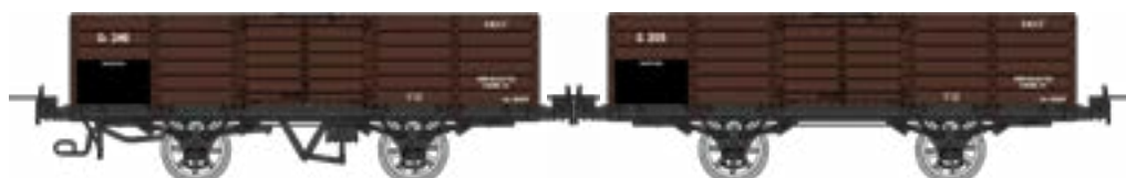
WM-034 Coffret de 2 tombereaux freiné et non freiné, bruns, SNCF, Gv 246 et G 205