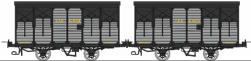
WM-027 Coffret de 2 couverts freinés, toit 2 pentes, ferrures Noires - Kv 4078 et Kv 4075