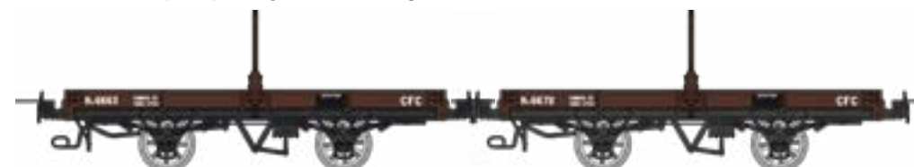
WM-037 Coffret de 2 plats porte-grumes freinés, bruns, CFC Htv 6663 et Htv 6672