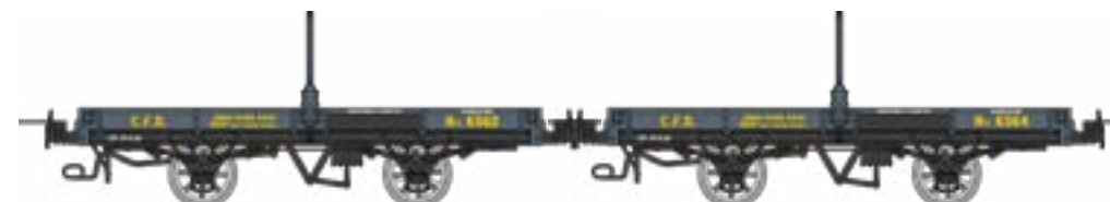
WM-036 Coffret de 2 plats porte-grumes freinés, gris Foncé, CFD Htv 6562 et Htv 6564