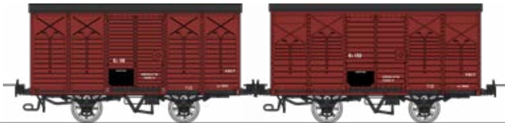
WM-029 Coffret de 2 couverts freinés, toit rond et toit 2 pentes, Rouge UIC SNCF - Kv 116 et Kv 132