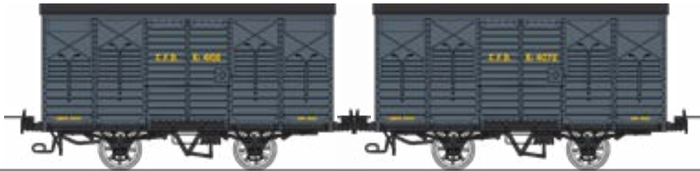
WM-028 Coffret de 2 couverts non freiné et freiné, toit rond et toit 2 pentes, Gris foncé - Kv 4102 et Kv 4072