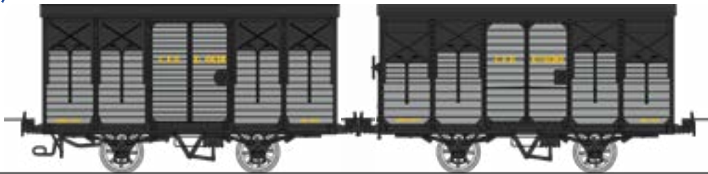
WM-026 Coffret de 2 couverts freinés, toit rond et toit 2 pentes, ferrures noires - Kv 4638 et Kifv 4082